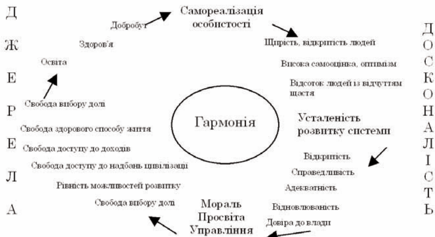
Рис. 1. Координати руху України

Оскільки відображення руху системи є спрямованим на людину, то для відображення динаміки України доцільно імітувати процес самореалізації людини власними силами і на власний розсуд. Людина реалізує себе, користуючись джерелами розвитку (освіта, досягнення цивілізації, медицина, природа, економіка, тощо). Стан країни як системи в цілому характеризується показниками сталості розвитку, що відображають рівень досягнення гармонії людини і оточення. Стан України характеризується координатами – показниками, зображеними на малюнку. У будь-який момент модельного часу можна визначити місце України в системі координат Всесвіту, вказавши значенням координат місцеперебування країни у часі-просторі. Блоки системи координат відповідають блокам імітаційної моделі розвитку людини в Україні.